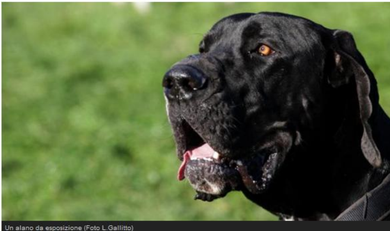
Un alano da esposizione

Previste esibizioni di Agility, Fly Ball, Disc Dog, Dog Dance e Paragility